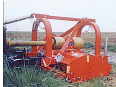
Bild: Mit Doppelbock

Bei Angabe Ihres Schlepper- typs sind für den Frontanbau Spezialausführungen möglich.