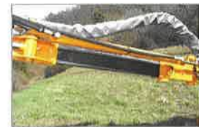
Teleskop ca. 70 cm