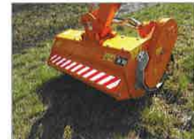
Mähkopf T 125 HD