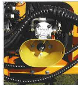
Getriebe mit Durchtrieb