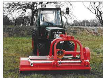
Serie EU mit Doppel-Linearverschiebung

Grundausrüstung und Sonderzubehör auf Rückseite