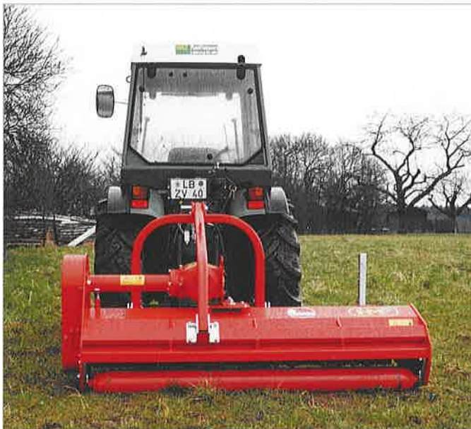
Serie EWP mit festem 3-Punkt Bock